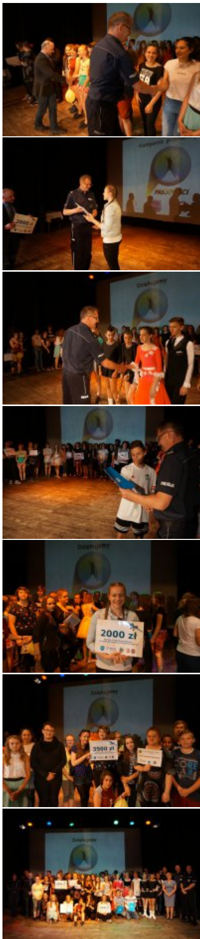
Kampania profilaktyczna - „Pasjonaci”, została zainicjowana przez policjantów Komendy Miejskiej Policji w Rybniku, w